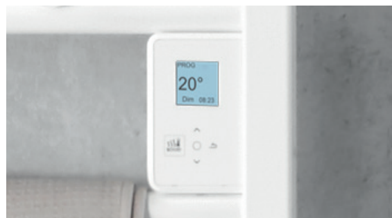
Boîtier digital tactile et programmable