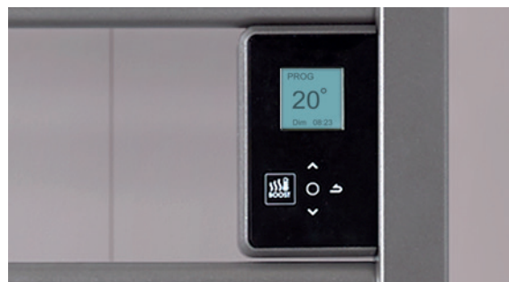
Boîtier digital tactile et programmable