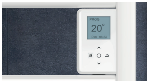
Boîtier digital tactile et programmable