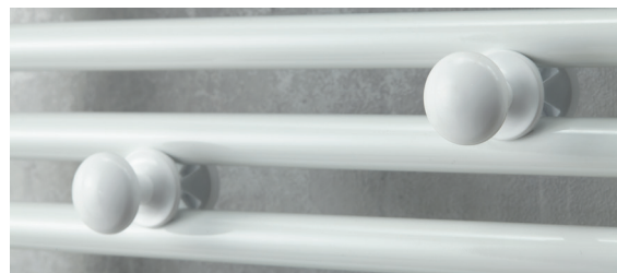
2 patères boutons amovibles