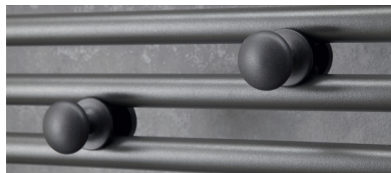
2 patères boutons amovibles