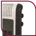
Boutons de commande