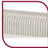
Grille de diffusion