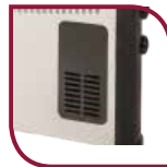
Ventilateur «Turbo» Incorporé TLS 503 T