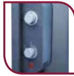
Boutons de commande