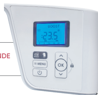
BOÎTIER DE COMMANDE PROGRAMMABLE