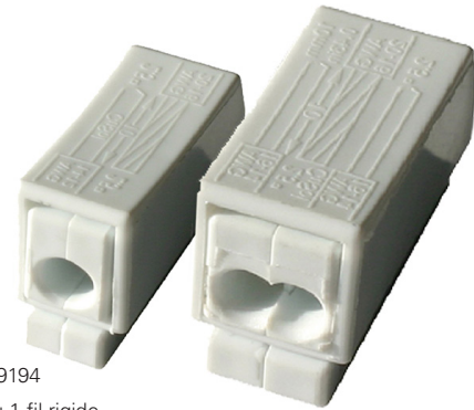
CAP309194 1 fil souple ou 1 fil rigide